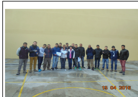
IMG. N° 003 Reinserción Social: Subprograma de Capacitación Laboral, CP Valdivia

Comentario: Se fiscaliza término de Curso de Capacitación en Oficio Peluquería módulo 71, el cual contó con la participación de 19 internos, quienes finalizan con éxito el proceso de capacitación.