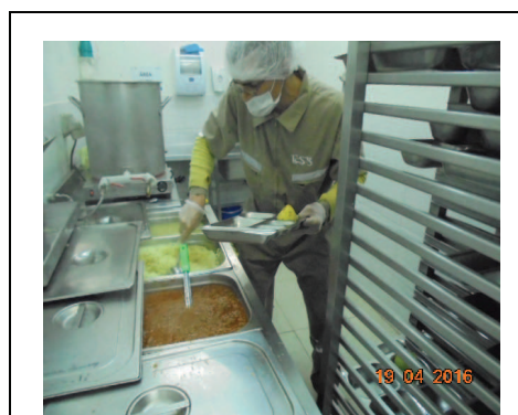
IMG. N° 001 Reinserción Social: Subprograma Laboral. Santiago 1

Comentario: En el marco del Subprograma Laboral, los internos tienen la posibilidad de realizar actividad laboral dependiente, ya sea como auxiliares de aseo o auxiliares reposteros. En la fotografía se muestra un interno desempeñando su labor como auxiliar repostero