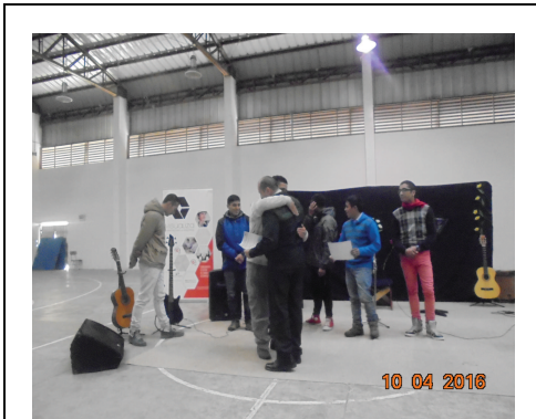
IMG. N° 002 Reinserción Social: Subprograma de Capacitación Laboral, CP Puerto Montt.

Comentario: Con fecha 10-04-2016, se realiza término de Cursos de Capacitación 2015 en el oficio de orfebrería ejecutados por la Otec Visualiza.